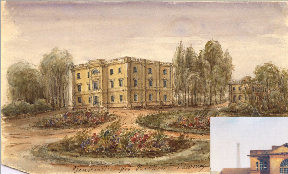
Dwór w Jankowicach, lata 40. XIXw. Akwarela Henry'ego Westmacotta