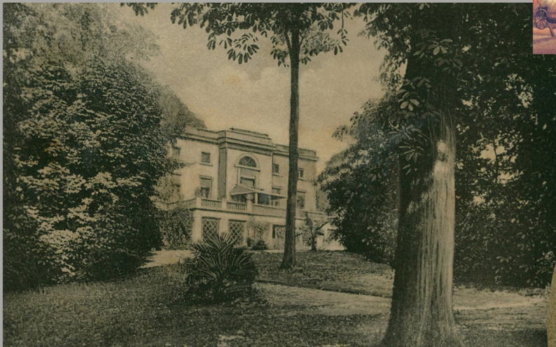
Widok elewacji dworu z parku. Pocztówka z przełomu XIX i XX wieku