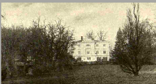
Widok dworu od strony parku. Fotografia z przełomu XIX i XX wieku. "Więś i Dwór" 1913 nr 4